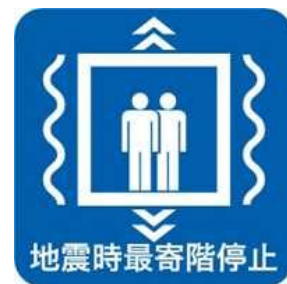
地震時管制運転装置設置済みマーク

本制度に関する詳細については、以下にお問合せください。 一般社団法人建築性能基準推進協会 電話：03-3513-7561 WEB: http://www.seinokyo.jp/