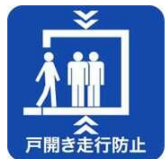
戸開走行保護装置設置済みマーク

本制度に関する詳細については、以下にお問合せください。 一般社団法人建築性能基準推進協会 電話：03-3513-7561 WEB： http://www.seinokyo.jp/