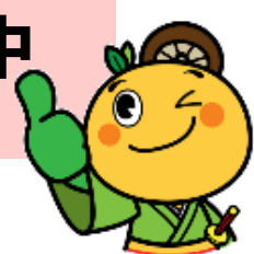
活動中の週一通いの場一覧 (令和6年1月現在)