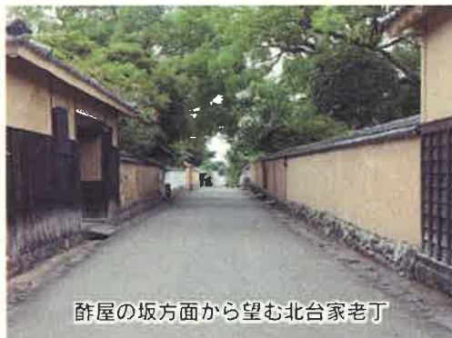
酢屋の坂方面から望む北台家老丁