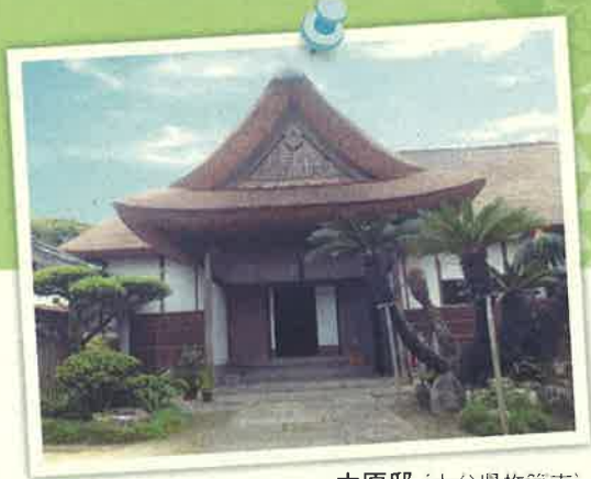
大原邸 (大分県杵築市)