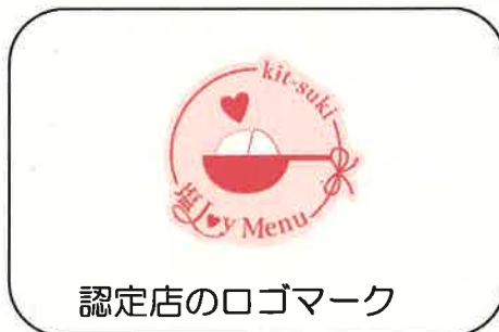
認定店のロゴマーク