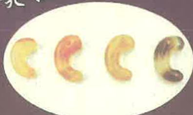
庚申塚古墳の勾玉(大分市)