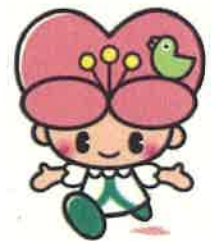
大分県人権啓発イメージキャラクター ころもちゃん