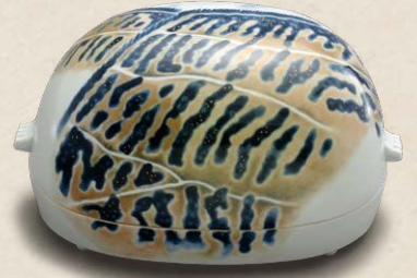
河合誓徳《みかん畑》2003年