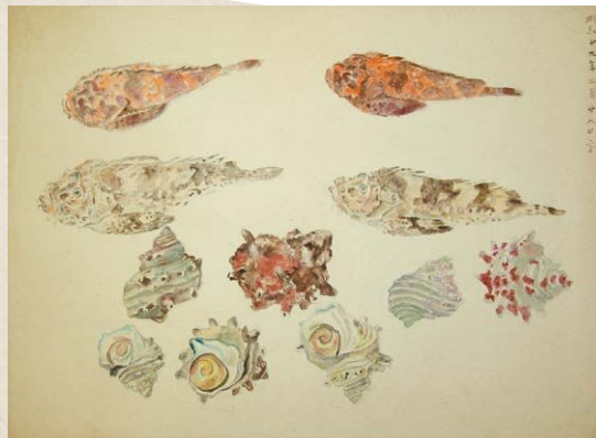
福田平八郎スケッチ《オニオコゼ・サザエ》1954年