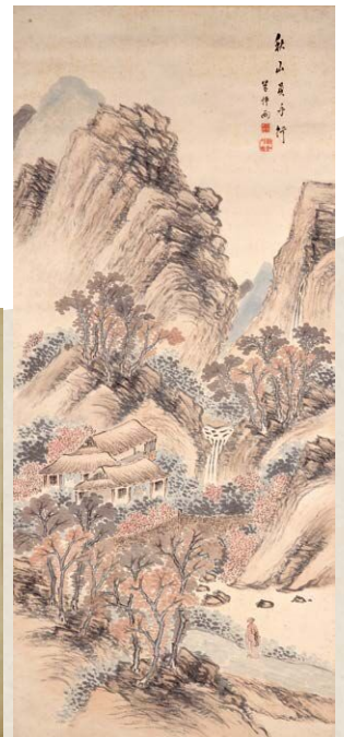
高橋草坪《秋山負手行図》1832(天保3)年