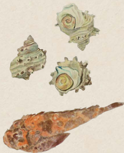
福田平八郎スケッチ《オニオコゼ・サザエ》(部分) 1954年