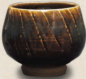
河井寛次郎《小鹿田焼 茶碗》1954年