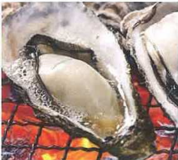
守江湾カキ焼きコーナー (大分県漁業協同組合)