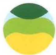
国東半島宇佐地域 世界農業遺産 Yunisaki Peninsula Usa GIAHS