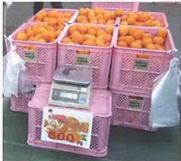
みかん販売コーナー (大分県農業協同組合)