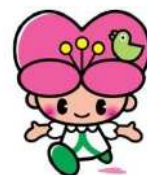
大分県人権啓発イメージキャラクター ころちゃん