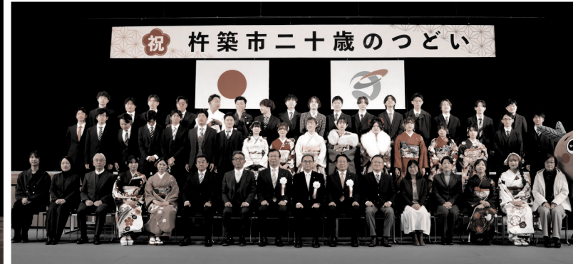
※集合写真は、上から杵築・宗近・山香中学校の順