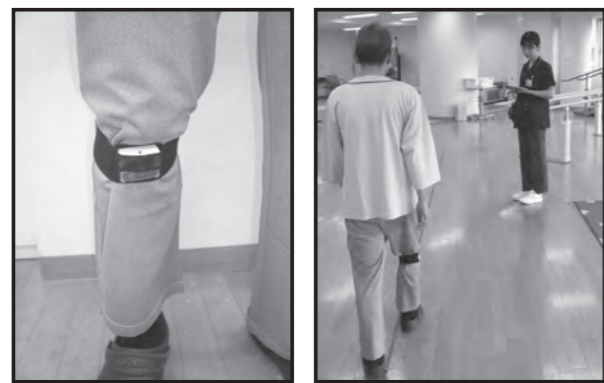
〈装着イメージ〉 〈歩行の様子〉

しくなり、要介護状態の入り口となることも少なくありません。そのため、膝の不調は我慢せず、早い段階から適切なケアや進行予防に取り組むことが大切です。 こうした背景のもと、当院では今年度に歩行解析計 iMU One を導入しました。この機器は、5メートル程度を歩いていたただけで、歩行時に膝関節への負担の程度が分かるという特徴があります。これまで歩き方の評価は、医療者の観察や患者様ご自身の感覚に頼る部分もありましたが、iMU One を用いることで、膝への負担を数値として「見える