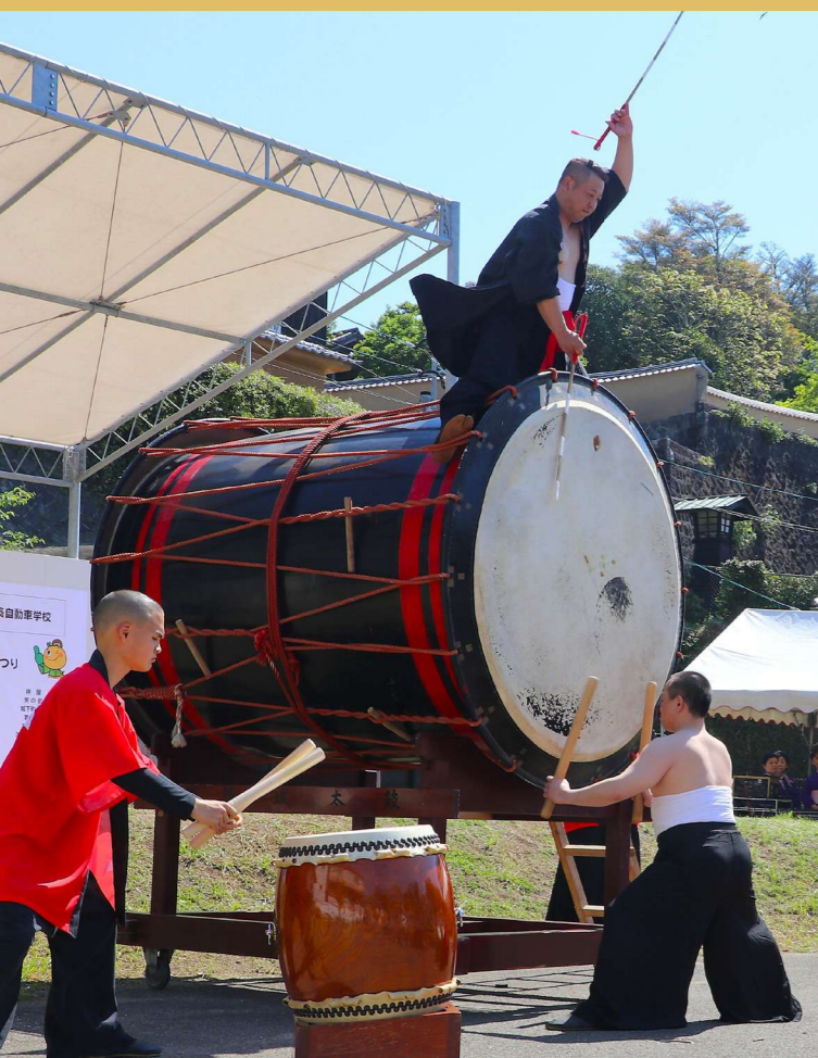
恒例のきつきお城まつりでは、圧巻の武者行列、迫力の火縄砲術演武に加え、今年は10年ぶりに大太鼓のパフォーマンスも披露され、城下町は17,000人を超える来場者で大いに賑わいました。来年、きつきお城まつりは、第40回を迎えます。