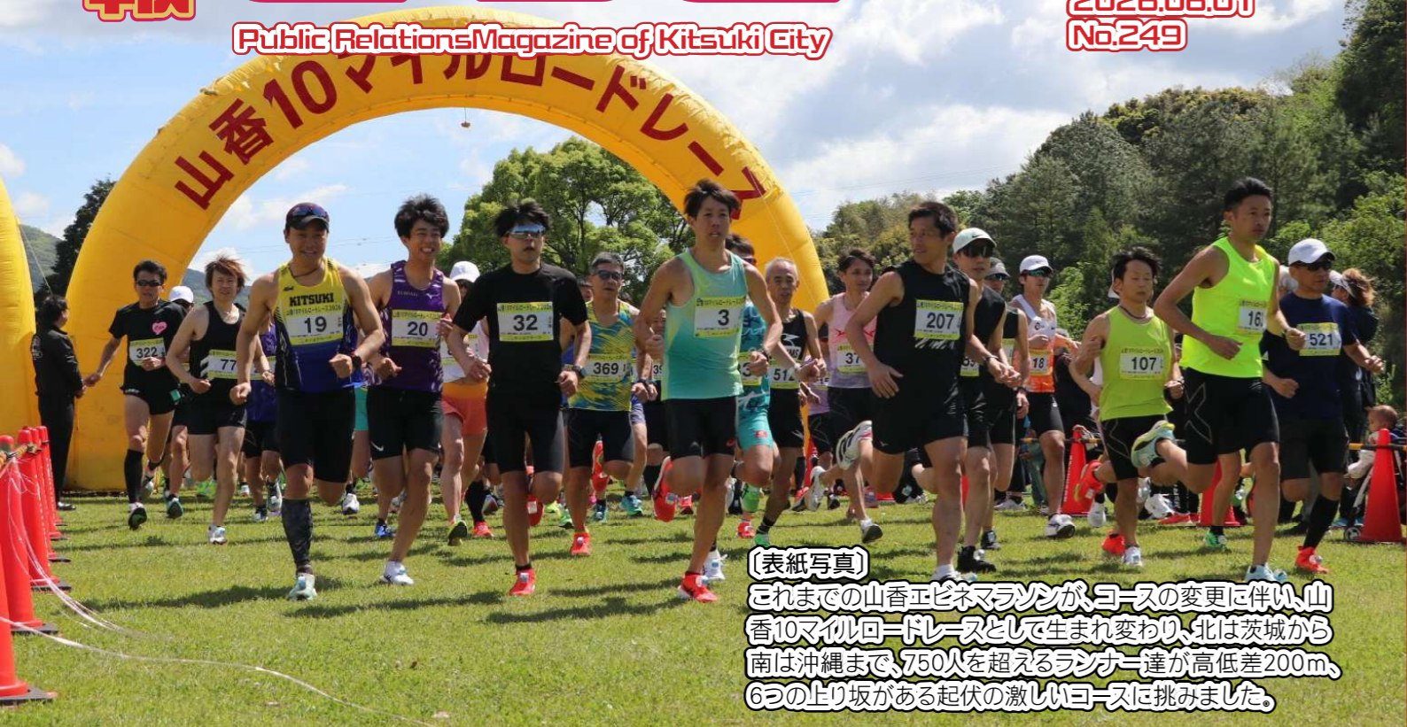
【表紙写真】 これまでの山香10マイルマラソンが、コースの変更に伴い、山香10マイルロードレースとして生まれ変わり、北は茨城から南は沖縄まで、750人を超えるランナー達が高低差200m、6つの上り坂がある起伏の激しいコースに挑みました。

印刷 有限会社三晃堂印刷 この広報誌は再生紙を使用し、環境にやさしく印刷されています。