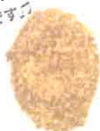
手作りコロケ 税込¥130