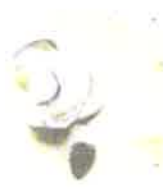
しじみの味噌汁 税込¥120