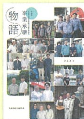
「事業承継物語2021」 (令和3年1月発行)