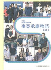
「事業承継物語2023」 (令和4年12月発行)

当センターで支援した事業者(親族内承継、第三者承継)の事例をまとめた小冊子です。电子版(PDF)は、当センターホームページからダウンロードしてご覧いただけます。