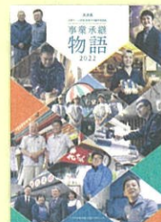
「事業承継物語2022」 (令和4年1月発行)