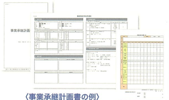
〈事業承継計画書の例〉

事業承継計画書の策定を通して、事業承継の実現から事業承継後の取り組みまで、円滑な事業承継を実現するための具体的な道筋を明確化する支援を行います。（無料、回数制限あり）