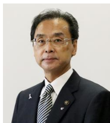
杵築市長 永松 悟

消費者を取り巻く環境は、高度情報通信社会の進展やキャッシュレス化等で激しく変化し、消費者トラブルの内容や解決方法も複雑化しています。