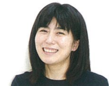
デザイン: 森 海里

信条は「企業に寄り添う」信用金庫、会計事務所での勤務経験を通じて感じるのは「数字の重要性」で、数字をベースに課題解決に取り組みます。税理士、中小企業診断士。