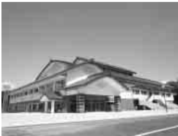
▲杵築市文化体育館

小学校耐震工事、山香統合中学校建設事業実施設計などを行いました。 また、ケーブルテレビ事業特別会計では、山香・大田地区へのケーブルテレビ整備事業を行いました。