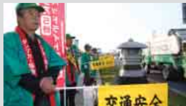
街頭指導のようす。早朝、白い息を吐きながら地道に取り組んでいます。

地道に街頭指導に臨む 杵築地区安全運転管理協議会と 大分県ダンブカー協会杵築支部