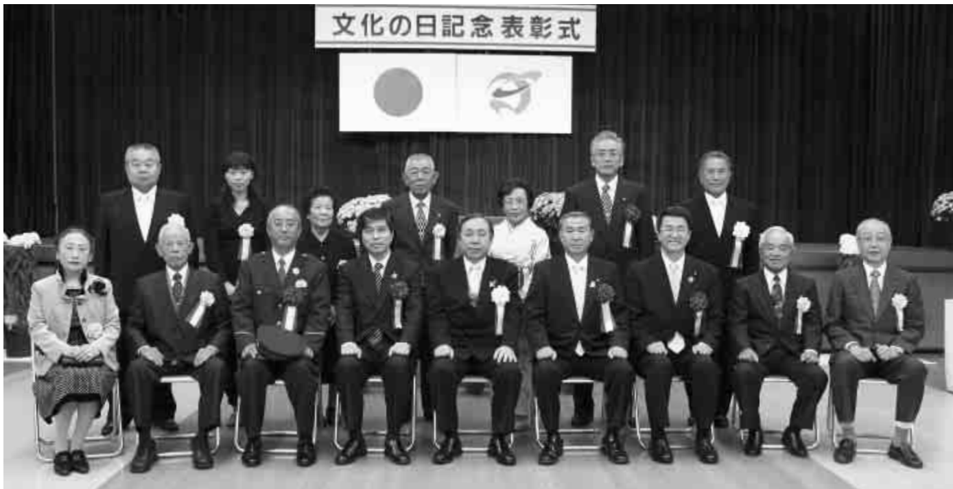
▲記念撮影(11月3日・杵築市文化の日記念表彰式)