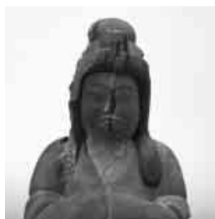
▲三神像(比売大神)／国重文