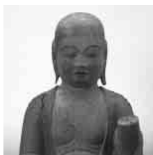
▲三神像(応神天皇)／国重文