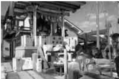
大漁と安全を祈願する恵美須神社のお祭り(11月14日)。あわせて、各家庭ではヨウカンをつくる風習がある。境内奥に鯨魂碑が祀られている。

東地区は、杵築市の南東部にあり、南は日出町と接し、東は別府湾の眺望美しい海に面した地域です。総人口は3,871人、高齢化率は27.3%(平成19年3月30日現在)。東小学校や健康福祉センターなどの公共施設のほか、守江港納屋泊地や加貫漁港といった海の玄関口もあり、終日賑わいに満ちた地域でもあります。また、熊野地区には、総区画数394区画の「ロイヤルシティ別府湾杵築リゾート」が開発され、市外から多くの転入者が移住、注目を集めています。