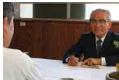
原則毎月第1水曜日に相談を受け付けている(詳しい予定は広報きつきに掲載)。

「行政相談委員」は、総務大臣が委嘱する民間の有識者。行政サービスに関する相談や行政の仕組みや手続に関する相談を受け付け、相談者への助言や関係行政機関への通知などの仕事を無報酬で行っている。現在杵築市には3人の行政相談委員が委嘱されている。