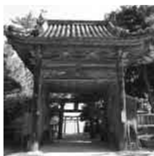
▲奈多宮楼門(市有文)