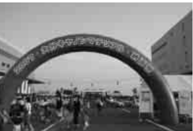
ひときわ目をひくほどの建物は大大キャノンマテリアル株式会社。夏には大規模な夏祭りも開催され、多くの市民で賑わいました。