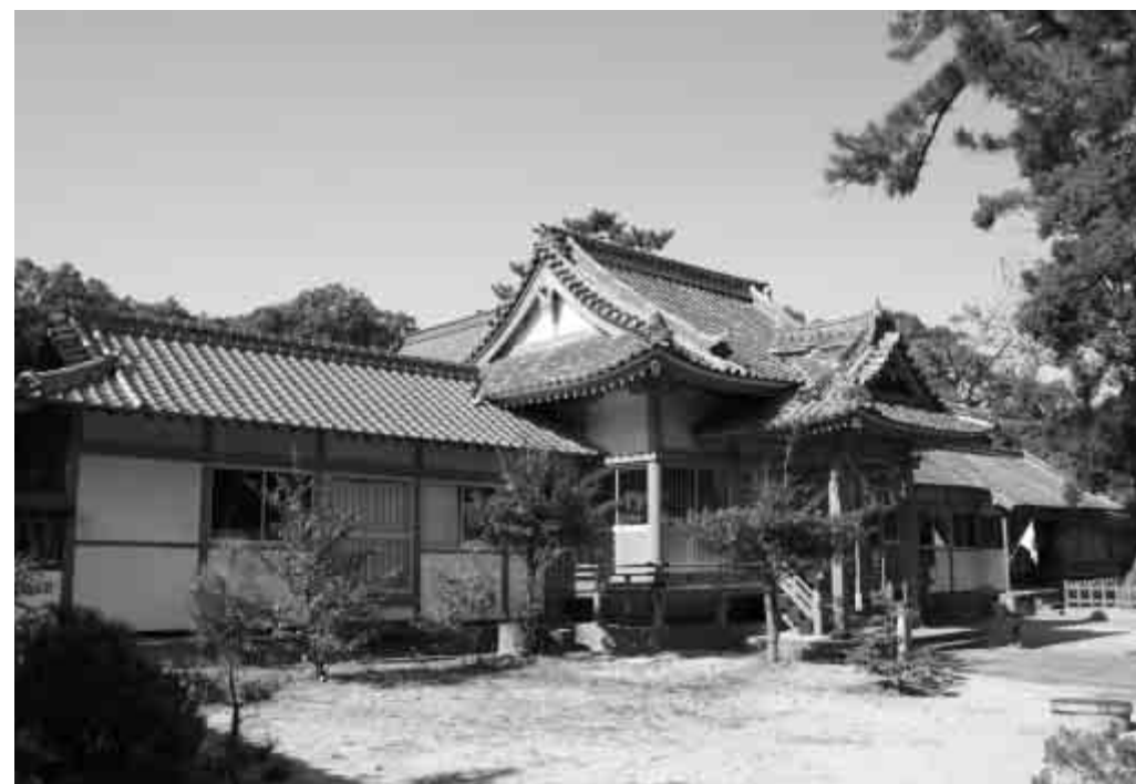
▲八幡奈多宮正面。神仏習合のシンボルとなる三神像(写真左)を所蔵している。

●世界遺産とは 1960年代、エジプトでナイル川流域にアスワン・ハイ・ダムの建設計画が持ち上がり、このダムが完成すると、ヌビア遺跡が水没する危機が懸念されたため、ユネスコが、ヌビア水没遺跡救済キャンペーンを開始。世界の60カ国の援助により、技術支援、考古学調査支援などが行われ、ヌビア遺跡内のアブ・シンベル神殿を移築、これがきっかけとなり、開発から歴史的価値のある遺跡、建築物、自然等を国際的な組織運営で守ろうという機運がうまれました。これが「世界遺産」条約化のスタートです。 1972年11月16日、ユネスコのパリ本部で開催された第17回ユネスコ総会で、世界の文化遺産および自然遺産の保護に関する条約(世界遺産条約)が満場一致で成立。翌年、アメリカ合衆国が第1番目に批准、締結。20カ国が条約締結した1975年に正式に発効しました。 第1号の世界遺産リスト登録を果たしたのは、アメリカのエエローストーンや、ガラパゴス諸島など12件(1978年)。日本は、1992年に世界遺産条約を批准し、その後、