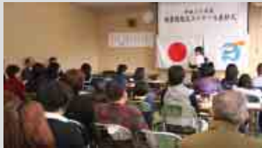
表彰式のあと、4人の最優秀賞受賞者による作品の朗読が行われました(12ページに受賞者名簿を掲載)。

特集 後期高齢者医療制度情報 ..... P2~3 ケーブルテレビ・データ放送開始 ..... P4 ITで農業がより便利に！ ..... P5 杵築エリアでもバス運行開始！ ..... P6