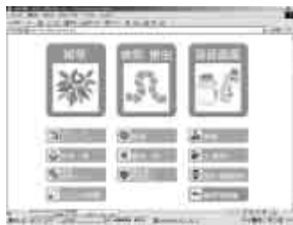
▲アグリネット(イメージ)

また、ＪＡ杵築市、ＪＡ山香町の取扱い農薬も表示されているので、「どの農薬を使えばよいか？」などと迷うことなく購入でき、皆さんの力強い味方となります。全国版の情報等も活用できます。