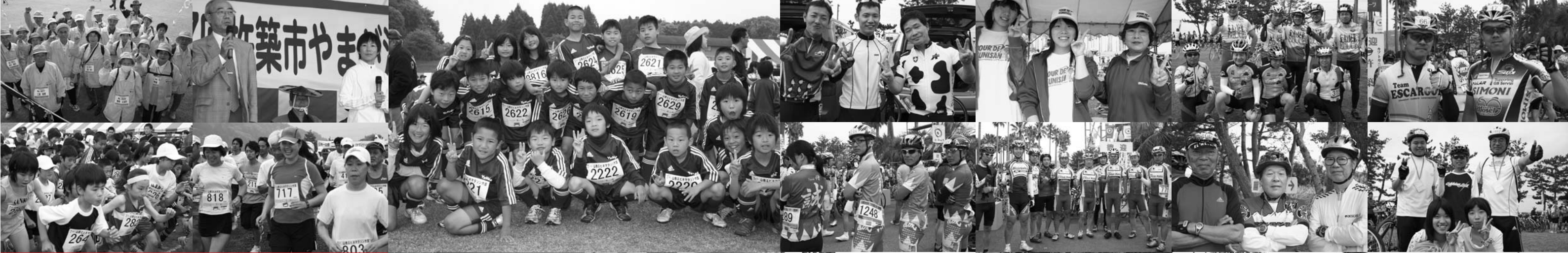
5月4日(月) 第12回日本一山香エビネマラソン大会