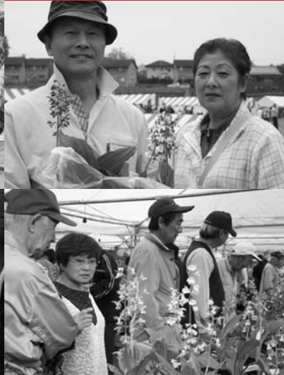
5月3日(日)・4日(月) 第27回やまが温泉エビネ祭り