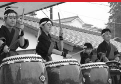
5月4日(月)・5日(火) 第22回きつきお城まつり