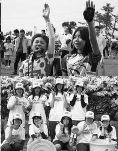
5月3日(日) 第28回ツール・ド・国東