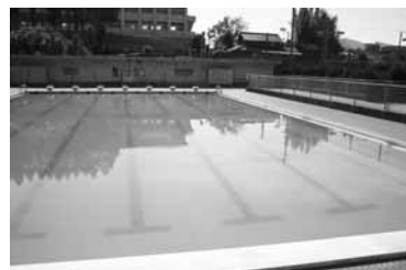
▲市営山香水泳プール