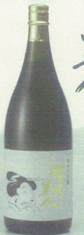
智恵美人「純米大吟醸」

大正期の木造二階建ての酒蔵を改修のほか、レストランや特産品コーナースペースを備えています。