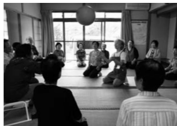
▲サロンの様子(風船バレー)

杵築市社会福祉協議会 ☎0978-62-2649 地域包括支援センター ☎0978-62-3131 ☎0977-75-2402