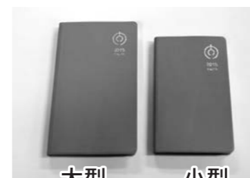
大型 14.9×8.9cm 小型 12.7×7.9cm