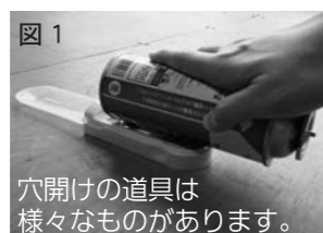
穴開けの道具は様々なものがあります。