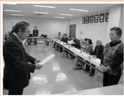
▲委嘱状交付式の様子

地域医療の崩壊が叫ばれる中、当日は是非多くの皆さんに足を運んでいただいで、地域の皆さんや同じ地域医療に携わる医療関係者の皆さんと、今後の地域医療について考えていきたいと思います。