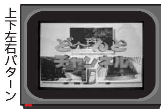
上下左右バターン

■機器の仕様により、動作が異なる場合があります。詳しくはお使いの機器の取扱説明書でご確認ください。