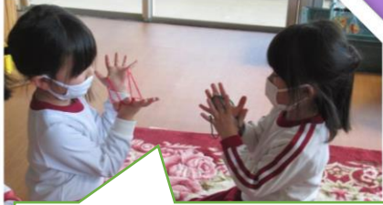
あやとり、おしえてあげる!

東幼稚園は3月18日(火)に、第74回修了証書授与式を行い、5名の園児が希望に胸を膨らませ、幼稚園を巣立っていきました。そして3月25日(金)は、年少組の修了式も行い、無事に令和3年度を終えることができました。保護者の方々、地域の皆様方には、1年間、東幼稚園を温かく見守っていただき、ありがとうございました。