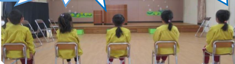
一緒に遊んだ年少組(ばら組)さんへの思いも伝えました