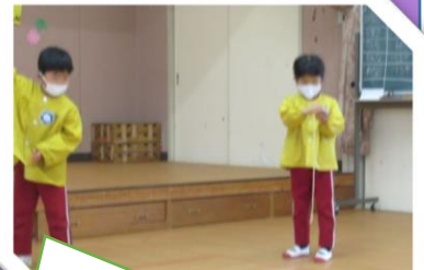
一緒にコマ回ししよう!

無事に卒園・進級できることをみんなで喜び、お家の方や友だちはもちろん、お世話になったいろいろな方々へ感謝の気持ちを伝える時間を作りました。