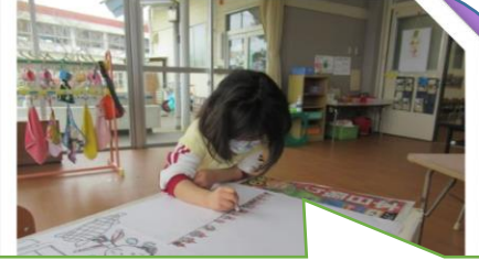
思い出を絵に描いて、発表したよ!

3学期は、あやとりやコマ回し、縄跳びなどを友だちと同士で教え合う姿が見られました。2/8(火)に行った生活発表会では、友だちと一緒に楽しく取り組み、自信につながりました。