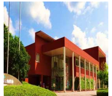
杵築市役所山香庁舎 外観