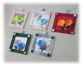
創作活動(フレーム作り)