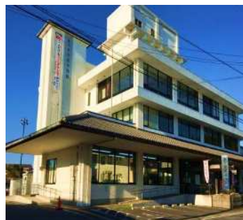
きつき生涯学習館 外観

山香教室 〒879-1307 杵築市山香町大字野原1010-2 杵築市役所山香庁舎 3階