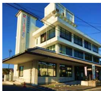
きつき生涯学習館 外観