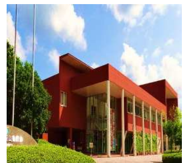
杵築市役所山香庁舎 外観