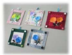
創作活動(フレーム作り)