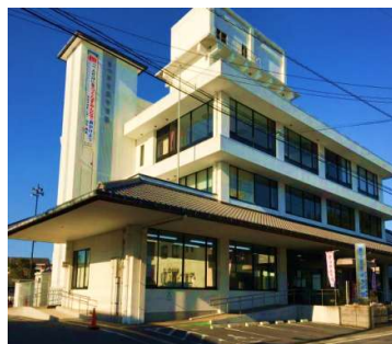
きつき生涯学習館 外観