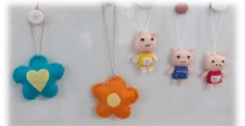
創作活動(マスコット作り)