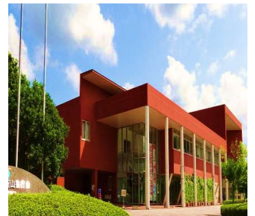
杵築市役所山香庁舎 外観