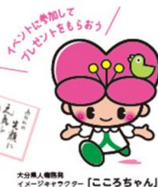
大分県人権啓発イメージキャラクター「こころちゃん」