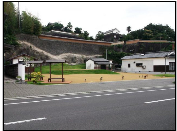
酢屋の坂下広場の整備

Q15 これらの事業についてどのように感じますか。次の項目について、該当する番号に○を付けてください。