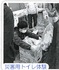
災害用トイレ体験