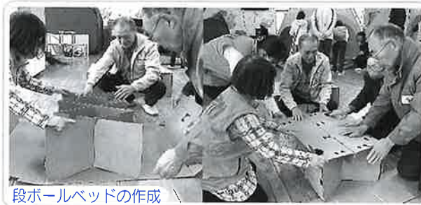
段ボールベッドの作成