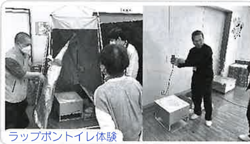
ラップポントイレ体験