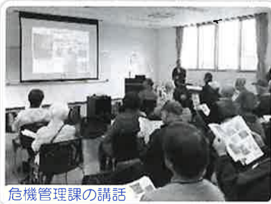
危機管理課の講話