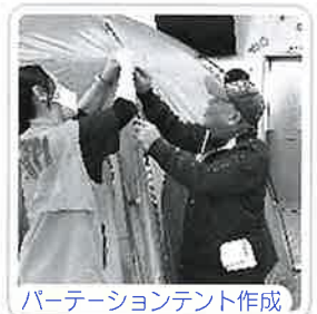
パーティションテント作成