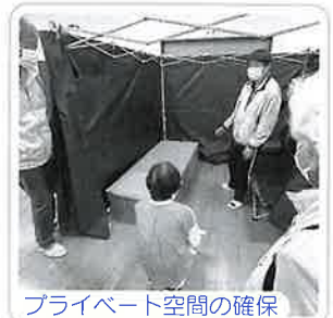
プライベート空間の確保