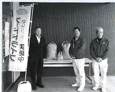
杵築ライオンズクラブ様