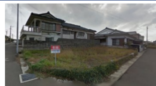
鹿児島県いちき串木野市(土地) 譲渡額約350万円