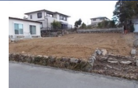
三重県津市(土地) 譲渡額約270万円