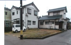
新潟県燕市(土地) 譲渡額約350万円