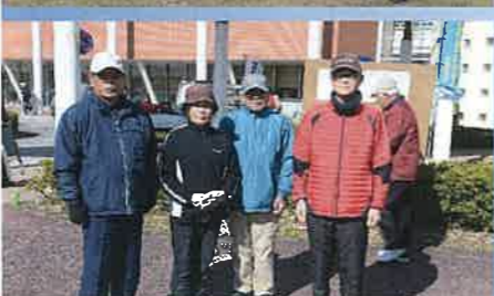
優勝した山口チームの皆さん おめでとうございます!

10位 田居A 11位 小武 12位 南部A 13位 北の原 14位 南部B 15位 大和B 16位 下村 17位 袖之迫 18位 大和C 19位 大和D