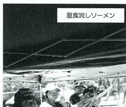
昼食流しソーメン