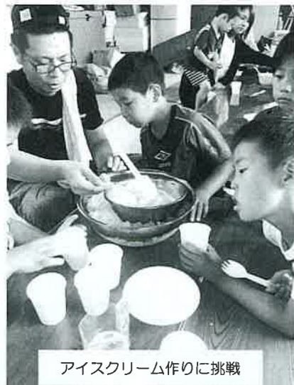
アイスクリーム作りに挑戦