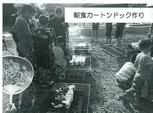
朝食カートンドック作り