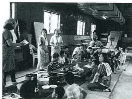
アイスクリーム作りの様子 5種類作り食べ比べ