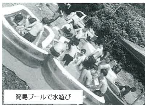
簡易プールで水遊び