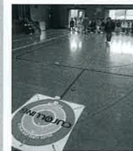
エタイル首巻き お手玉の入れ

まず、来場者順に保健師による血圧測定を行い簡単なアドバイス頂き、今日の自分の健康状態を意識しながら、健康教室に参加しました。楽しい時間を共有し、健康の大切さを再認識して「来てよかった！！」という声を沢山頂きました。今後も継続して取り組んでいきたいと思っております。ご協力ありがとうございました。