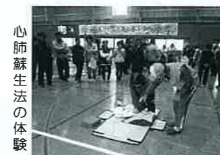
心肺蘇生法の体験