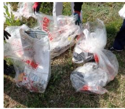
八坂川のごみです！