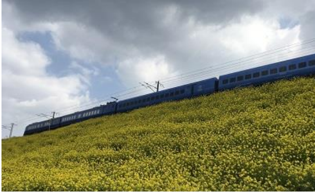
見事に咲き誇った出原の菜の花（2020年4月）