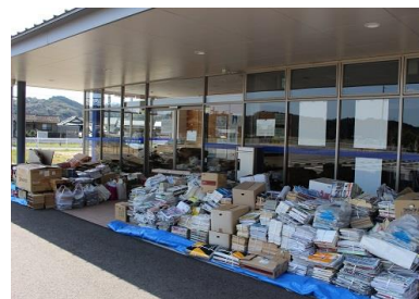
(公民館に集まった大量の古紙)

3月21日～23日古紙回収リサイクル運動に取り組みました。地域の皆さんから大量の古紙をいただき収益金は42,650円になりました。八坂地区のために大切に使用させていただきます。