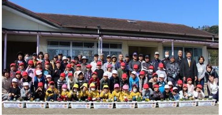
花いっぱい運動 参加者全員で記念写真(2020年2月)

今年の八坂地区出原土手の菜の花は、ひときわ見事に咲き誇りました。新型コロナウイルスの対応で世の中が何となくどんよりしている中、春の季節を実に華やかに彩り、地域の方々の目を楽しませることに一役かったのではないのでしょうか。また、あちこちから鉄道マニアの方も訪れ、3密に注意しながら写真におさめる姿をたくさん見かけました。