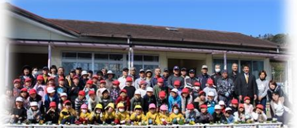
花いっぱい運動は実施の予定です。