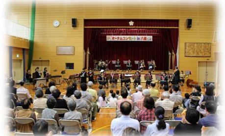
秋恒例のオータムコンサートは今年度新型コロナウイルス感染拡大防止のため中止としました。

これまで八坂地区住民自治協議会は、地区の皆様や地域活性化のため様々な活動を企画し行ってきました。その活動は、杵築市からの交付金で賄ってきましたが、これからは地域住民自らで動かしていくように方針が変わりつつあります。それで古紙回収運動などを行い、活動資金の準備を始めました。しかし住民の皆様の要望を実現していくための活動を充実させ、後継者に無理なく引き継ぐことも考えると活動費が足りません。それでこれまで役員会や区長会で何度も協議し「八坂自治協会費」として1家庭あたり年間100円程度の会費をお願いしてはどうかの考えに回っています。詳細が決まりましたら、正式なお願い文書を各区の総会までにお届けしますので、ご覧下さり、ご理解ご協力よろしくお願いたします。